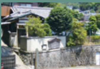
▲光風荘。東京以外で唯一「226事件」の現場。当時の遺品などの現物が展示されています。

古くから文豪、画家など多くの作家が滞在し創作の筆をとった町「湯河原」。四季を通じて温暖な気候と自然に恵まれた環境で知られ、湯治場としても有名な町です。