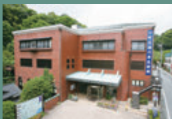
▲町立湯河原美術館。郷土の大切な文化遺産を後世に伝える役目を持った美術館として愛されています。