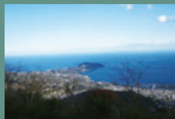
▲土肥城跡地。源頼朝の腹心、土肥実平の城跡といわれる地。相模湾や真鶴岬が一望できます。