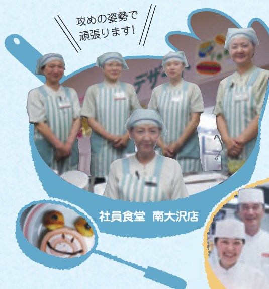
社員食堂 南大沢店

ひとりが何か行動し始めると、次は私が！と行動を起こしてくれる従業員ばかりです。自分では無理と思っている人も「かわいくできたね」と良いところを見つけてあげられれば、自信にもつながりますよね。自分で考える意志を持てば、自然と振り返りが生まれてきます。お客様に喜んで頂き、従業員も楽しく働けるように、常に攻めの姿勢で毎日頑張ります。