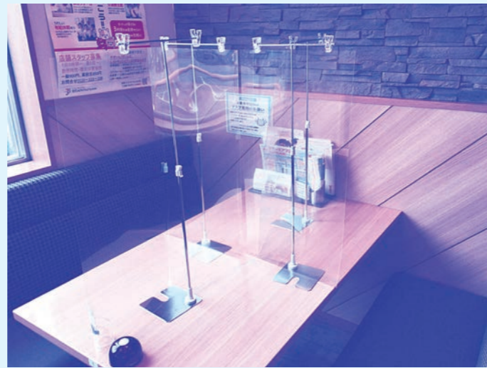
十字型のパーテーション