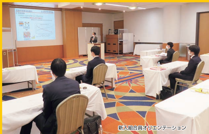
新入組合員オリエンテーション