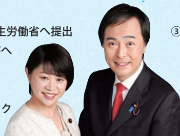
田村 まみ参議院議員（左）とかわいたかのり参議院議員（右）