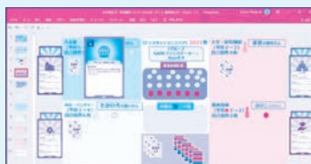
オンライン上でカードゲーム