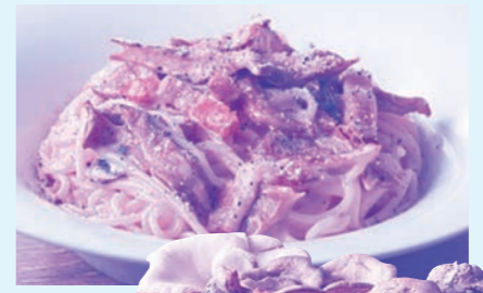
山梨夏っ子きのこ

山梨はとても地元の食材を使ったメニューに関心がある地域です。毎年フルーツ系のデザートは全社でも上位の販売実績があり、地産地消の観点からも積極的に販売をしています。限定数量の販売のため、お客様から「販売をしていますか?」と多くのお問い合わせもあります。お客様がご来店する「きっかけ」となっているメニューなので、今後も山梨県と連