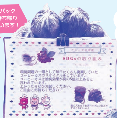
自由にお持ち帰りできるコーヒーかす