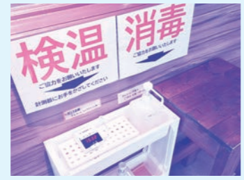
検温と消毒のセット

県が設定した基準をクリアしていれば認証が得られ、時短や酒類提供自粛をせずに、営業ができる制度となっており、店舗の入り口などに貼られた緑色のステッカーが認証の目印となっています。