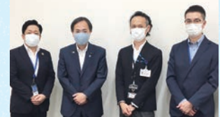
農林水産省へ外食産業再興にむけての意見交換

私たちの声を国政の場に届けてくれる、かわいたかのり参議院議員、田村 まみ参議院議員を応援しよう！