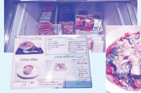
従業員によるオリジナルメニュー