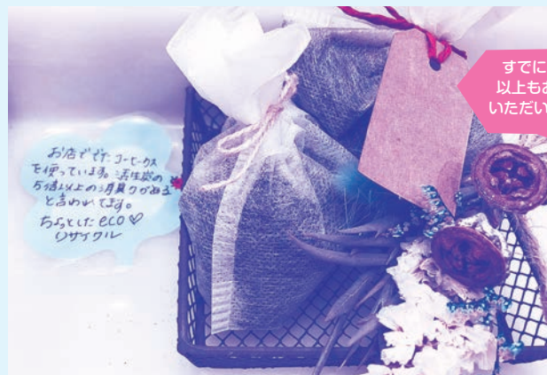
トイレに設置したコーヒーかす