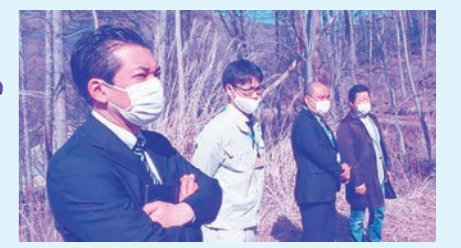
山梨県の職員と視察