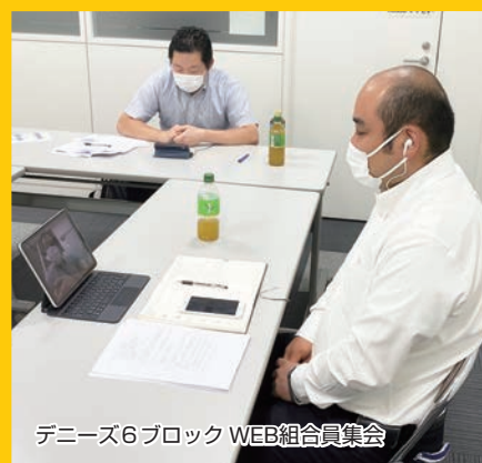
デニーズ6ブロック WEB組合員集会