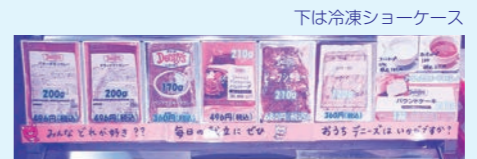
下は冷凍ショーケース