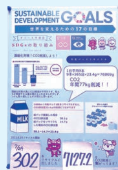
牛乳パックの取り組みポスター

コーヒーかすの配布は想像以上にお客様からの反響が大きく、従業員も「喜んでいただけた」「お客様との会話が増えた」と喜んでいきます。私たちがお店でできることは地球規模で見たら、とても小さなことかもしれませんが、しかし輪が広がり一人ひとりが意識を持ち、行動を変えることによって大きな変化に繋がると思います。