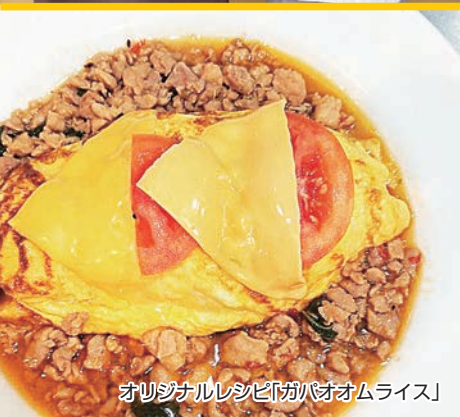
オリジナルレシピ「ガバオムライス」