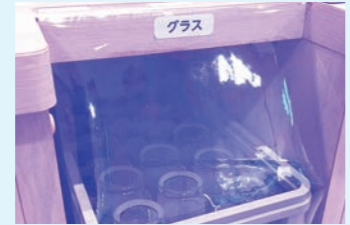
グラスカバーを設置