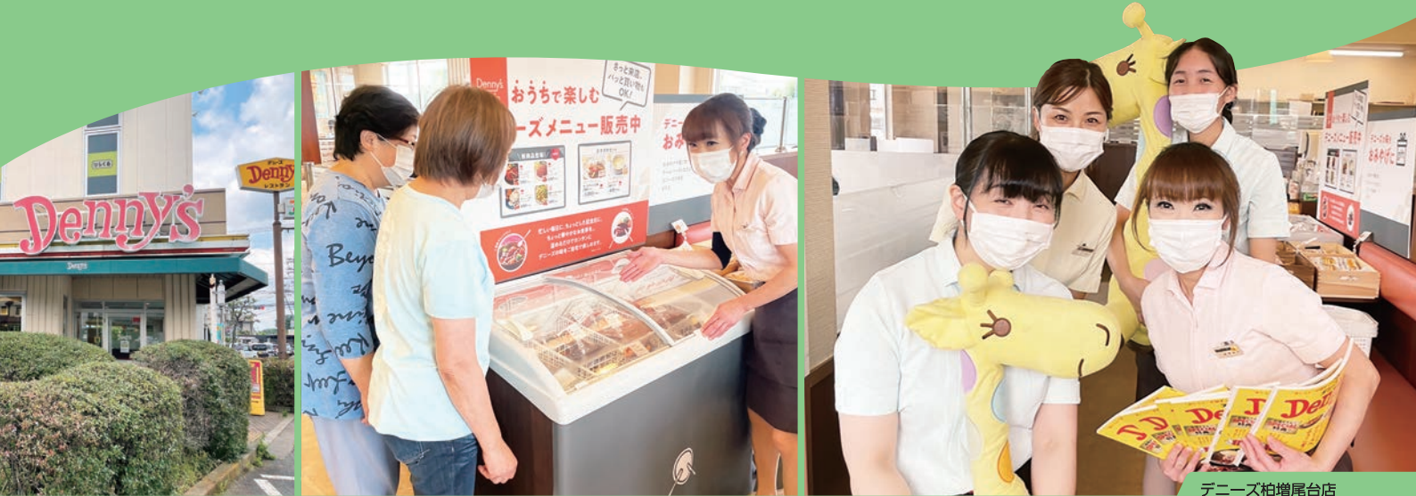
デニーズ柏増尾台店