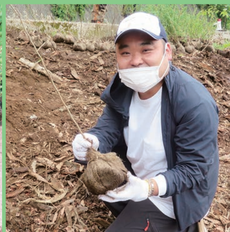
第1回セブン&アイ・フードシステムズの森づくりボランティア