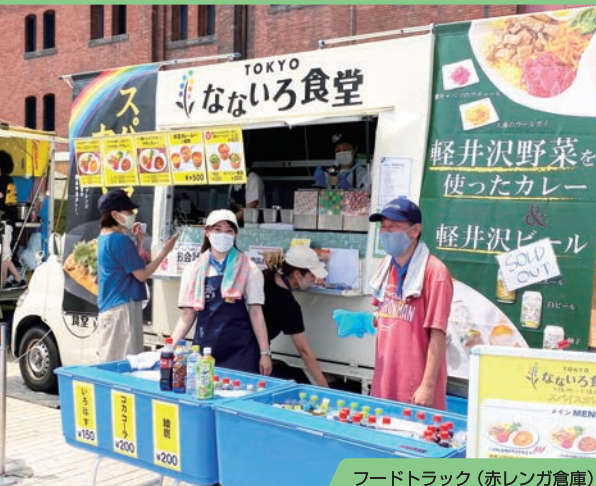
フードトラック (赤レンガ倉庫)