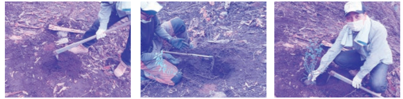
①穴を掘り ②肥料を撒き ③苗を入れ