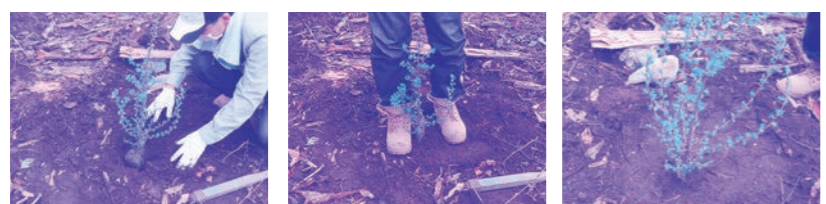
④土を被せ ⑤周りを踏み ⑥水をかけて完成