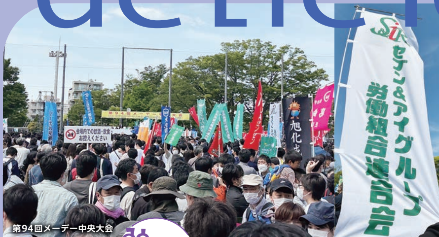
第94回メーデー中央大会