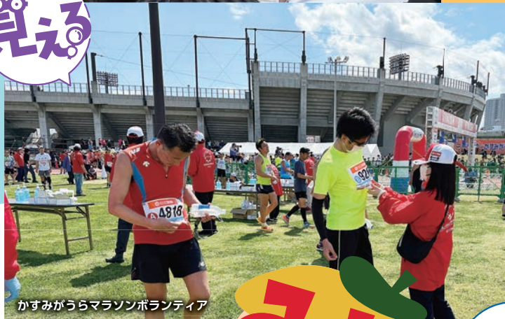
かすみがうらマラソンボランティア