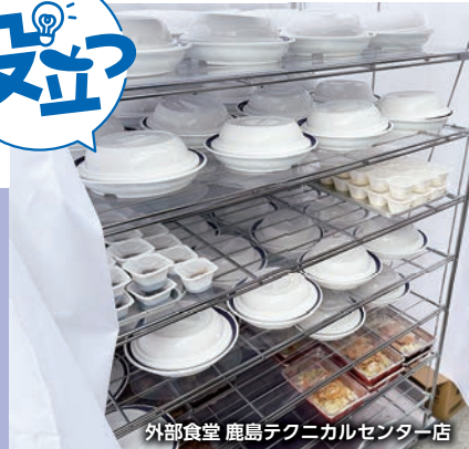
外部食堂 鹿島テクニカルセンター店