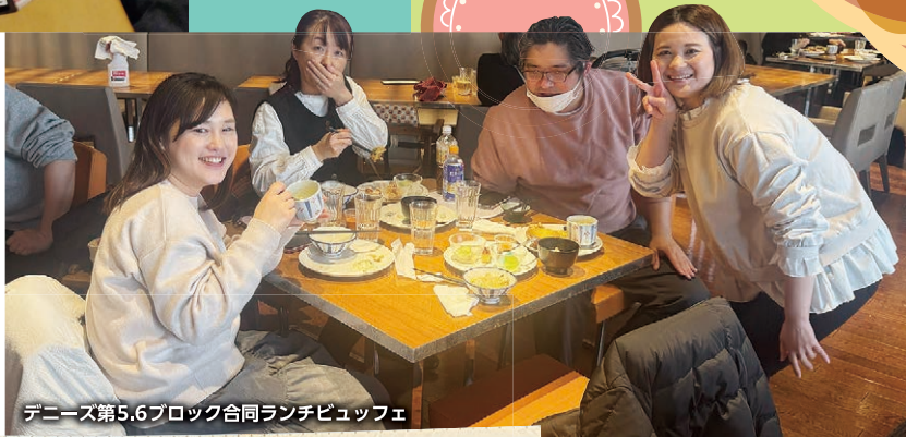
デニーズ第5,6ブロック合同ランチビュッフェ