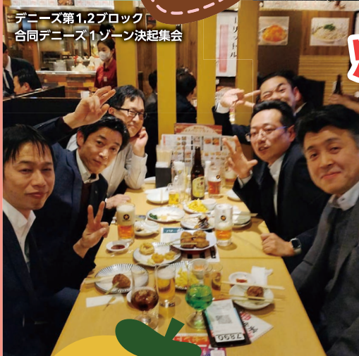
デニーズ第1,2ブロック 合同デニーズ1ゾーン決起集会