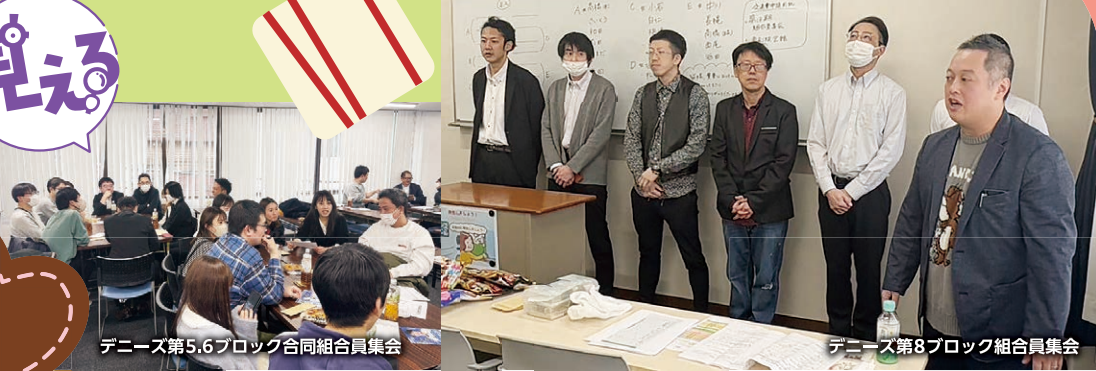
デニーズ第5,6ブロック合同組合員集会